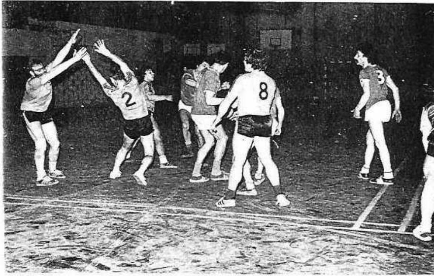
Phases du match.

Un bon derby 18 Avril 1975 Bayard-H.B.C.A. 22-17