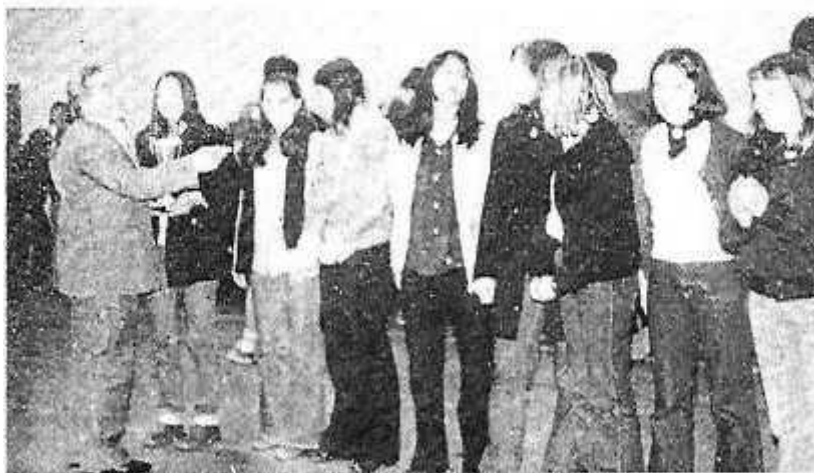
Les demoiselles du S.U.C. pour la 1ère édition

Les féminines d'Argentan imitèrent les garçons, 11 à 6 devant Avon (aussi).