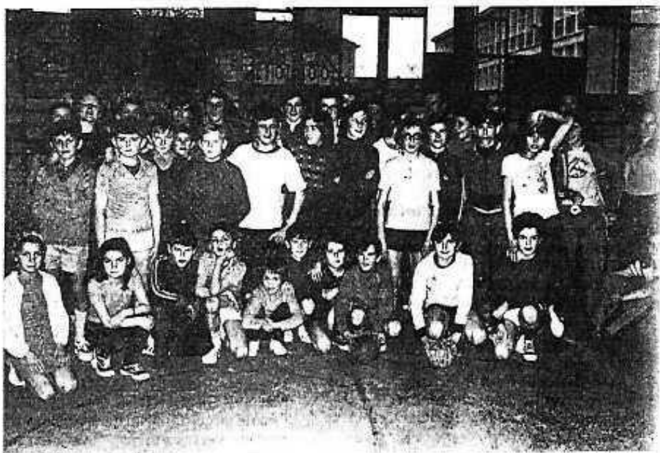
L'école de Hand du H.B.C.A. qui fonctionne tous les samedis, salle du lycée à partir de 14 h. Inscriptions sur place à partir de 10 ans (filles et garçons).