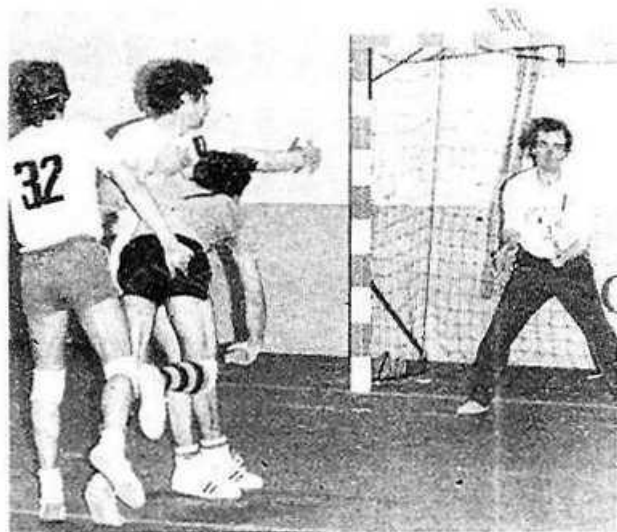
Un nouveau but pour La Bayard

Cadets: Victoire par 25 à 11 sur Ecouché. Toute l'équipe est à féliciter.