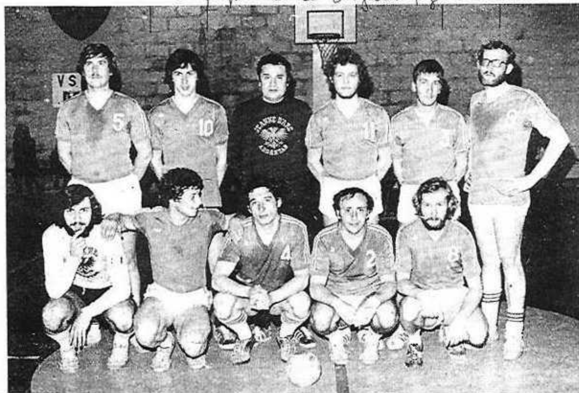
L'équipe de la Bayard-Argentanaise

US Flers bat HBCA 7-3 CSA bat CA L'Aigle 11-6 BA bat Mortagne 12-3 HBCA bat L'Aigle 7-4 Mortagne bat Ecouché 15-1 CSA bat Flers 8-4 CAS bat HBCA 11-5 Bayard - Ecouché 14-1 Flers bat L'Aigle 8-5 1/2 finales : Alençon bat Mortagne 16-10 Bayard bat Flers 5-4 Finale : Alençon bat Bayard 16-10.