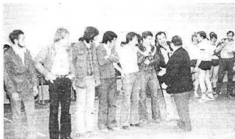
La Bayard en honneur