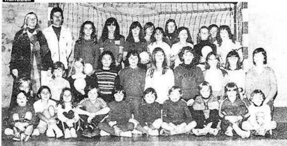
Ecole de hand de La Bayard