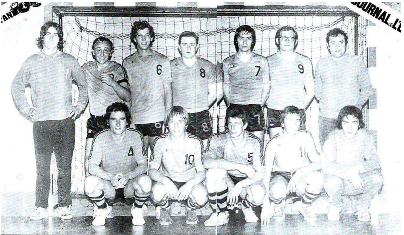
Les handballeurs de la Bayard Argentanaïse en tête de leur championnat

Pesrard et Coten 6 - Marrière 3 - Leveau et Gruel 1.