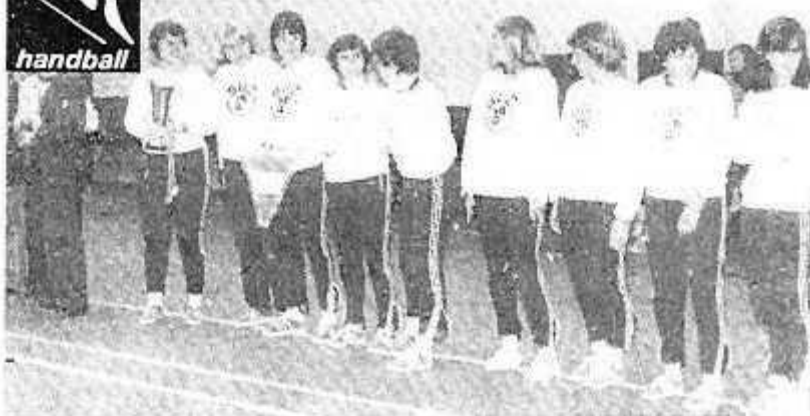
Les demoiselles de la Bayard aussi bien que les masculins

Dix-neuf équipes se retrouvaient à Argentan pour disputer les coupes FSCF. Elles étaient venues de toute la France puisqu'il y avait là aussi bien Strasbourg que Nantes.