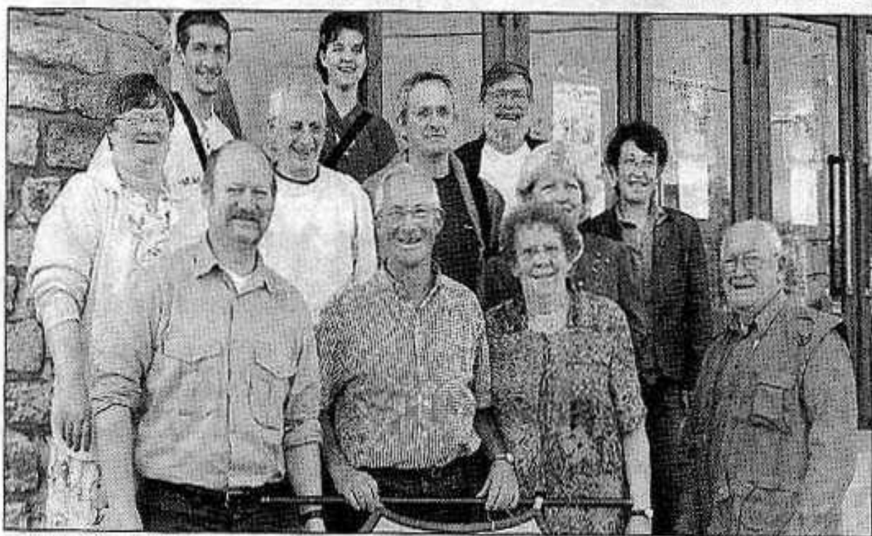
L'équipe d'organisation de l'anniversaire de la Bayard est à pied d'œuvre pour que tout soit prêt le 19 juin.

Contact : Bayard argenteraise, 65 rue de la République, 02 33 36 13 54.