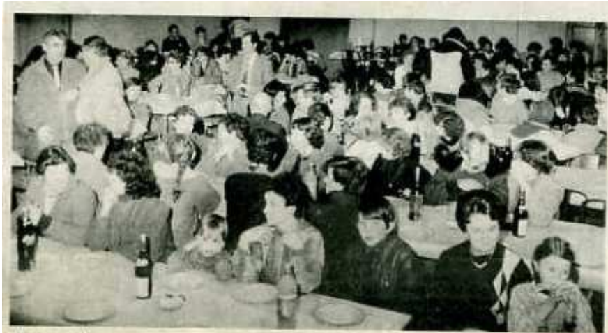
Une salle comble

monitrice de gymnastique et d'éducation physique, ce qui lui a permis d'enseigner.