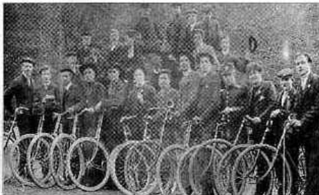
A l'époque de la jeunesse catholique, les sorties à vélo étaient courantes