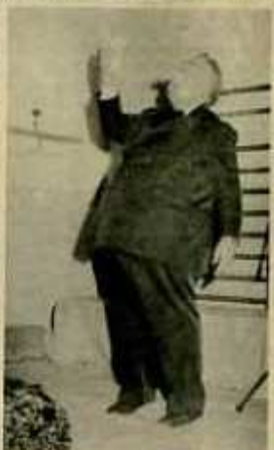
« libérandu », un gros mangeur