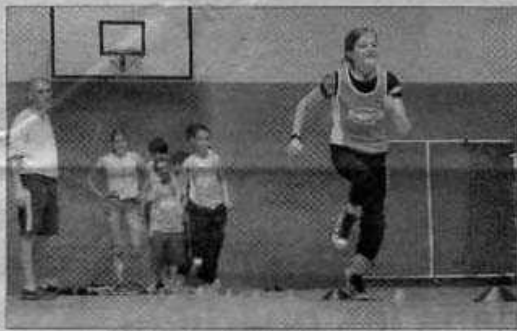
Le "mobi stade" a été mis en place