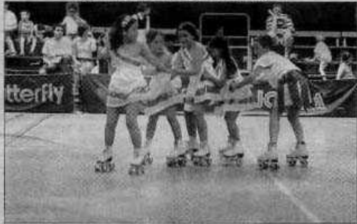
Des représentations des patineuses ont ponctué l'après-midi