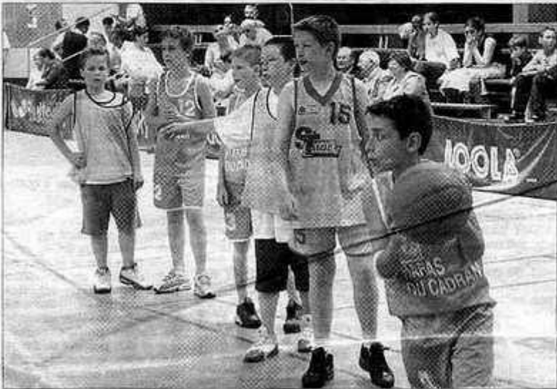
Les benjamins de la Bayard ont joué un match amical

A cette occasion, deux figures emblématiques ont été récompensées pour l'ensemble de leur travail bénévole au sein de l'association :