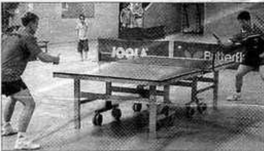
Deux joueurs de N1 sont venus faire une démonstration de tennis de table