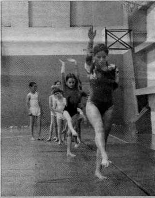
La gym, une des premières disciplines de la Bayard, a bien évidemment été représentée