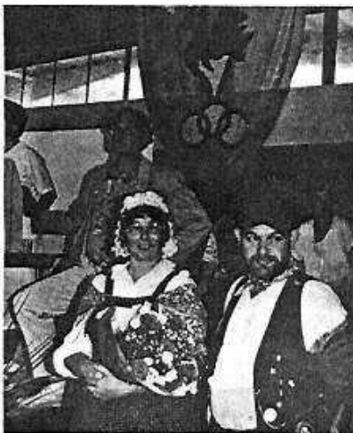
La Normandie (et La Gigouais) vous accueille

Garenne (94) 511,90 ; 6. Pacific, Carrières/Passy (78) 500,95 ; 7. Association Sportive, Vittef (88) 600,10 ; 8. Olympique Club, Gât-sur-Yvette (91) 491,40 ; 9. Patro Club, Lambresart (59) 488,25 ; 10. Etoile de Montaud, St-Etienne (42) 445,10 ; 11. Association Sportive, Railleux (07) 421,05.