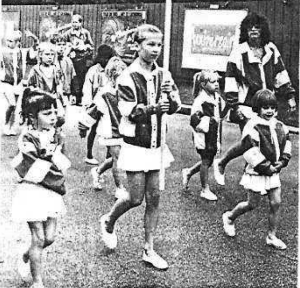
Le Bayard ferme la marche