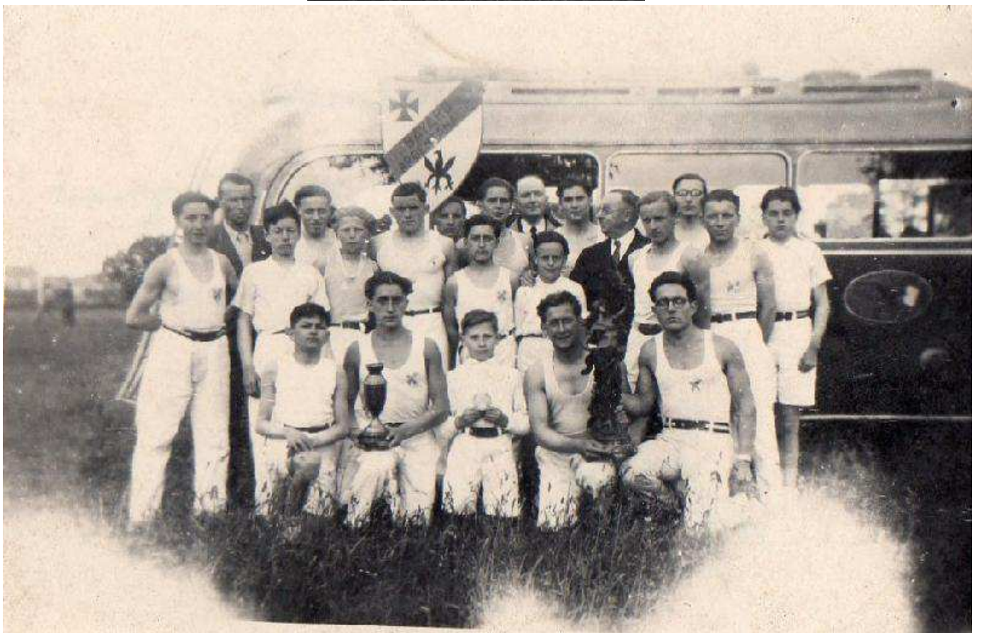
Au concours départemental de Mortagne le 18 mai 1947