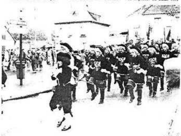
Le Pas Cadencé d'Argentan amène le défilé

Le festival de l'après-midi, qui devait conclure en beauté ce week-end fut quelque peu contrasté par la météo qui le contraignit à se déplacer du stade vers