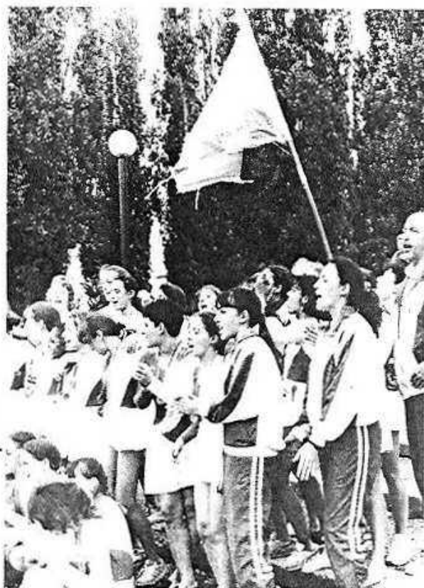
Marseille, l'une des équipes les plus sympathiques du festival

Pour le petit millier de personnes venues des 4 coins de France, Dunkerque, St-Malo, Mugron (Landes), Marseille, Fossey... et qui pour beaucoup possèdent pour la première fois les poids sur le sol Normand, le seul nom d'Argentan évoquera à jamais le souvenir d'une belle fête.