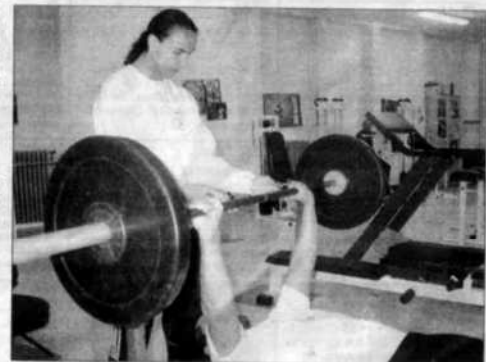
La section propose une vingtaine d'appareils de musculation heures d'ouverture de la salle ou 36 13 54), du mardi au vendredi au secrétariat de la Bayard (02 33 de 14 à 19 heures.