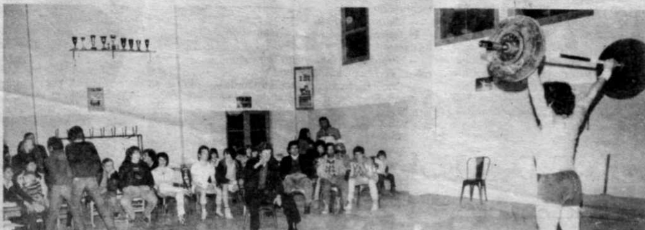
Devant les juges