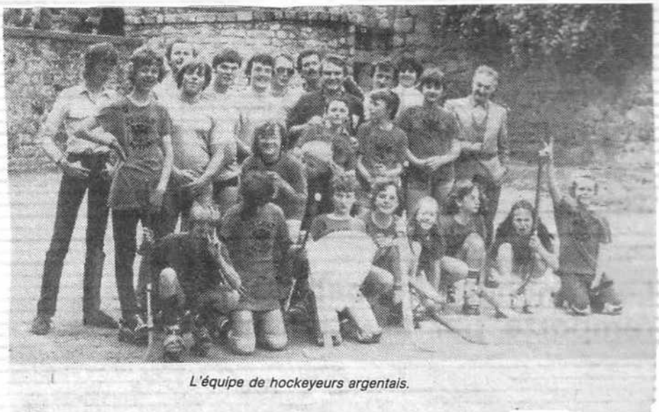
L'équipe de hockeyeurs argentais.