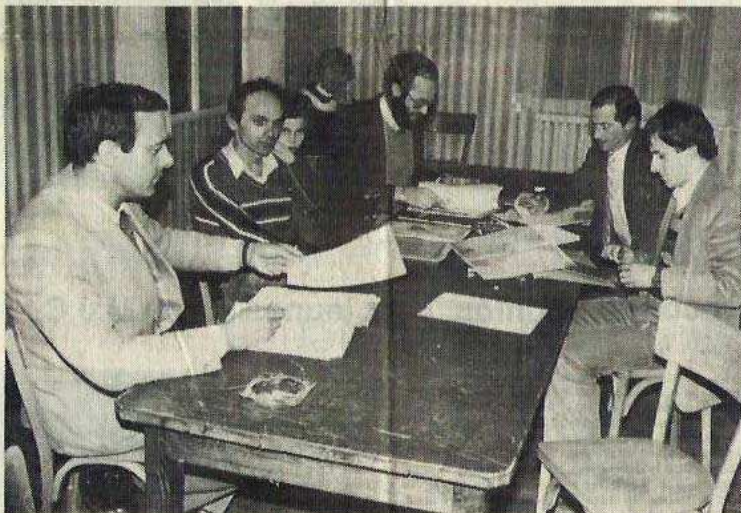
Pour les organisateurs, le marathon d'Argentan est l'aboutissement d'une vieille idée.

Le plan des deux kilomètres : encore quelques détails à revoir, concurrence d'un concours d'accordéon le même jour au hall expo oblige.